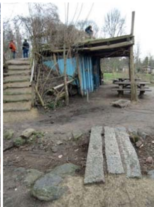
Heuvel, water en groen doet verschillende plekken ontstaan.