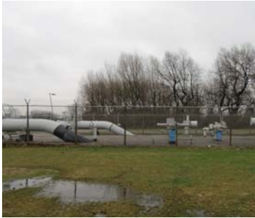
Pompstation tussen Ruige plaat en woonwijk

Naar aanleiding van een Internationale Bouwtentoonstelling is er besloten om een wijkevenementenhal te bouwen. Deze recreatiesite is omheind. Een pompstation vormt bovendien een hindernis tussen de Ruige Plaat en de wijk.