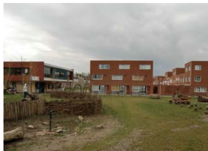
Woningen en kinderopvang kijken uit op terrein