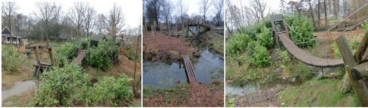
Woeste weiden: centrale heuvel en waterbeek deelt de ruimte op

De sterkste ontwerpen leggen ook de link met het landschap . Zo omvat de Speeldernis, gebouwd op een kleirijke bodem een weelderige vegetatie. In de Ruige Plaat (eveneens een ontwerp van Sigrun Lobst) wordt het oeverlandschap van de Maas geëvoceerd. De schrale kiezelbodem geeft een totaal ander landschapsbeeld. Elk eilandje krijgt eigen accenten en andere uitdagingen.