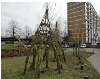
Avonturentuin Stellenbos: Permanent toegankelijk.

Ook de educatieve tuin De Enk is overdag in principe voor iedereen toegankelijk. Wanneer de poort openstaat, is er vrijwel altijd wel iemand van de organisatie in de buurt. De site is publiek domein, maar het gevoel heerst dat je een semiprivate ruimte betreedt. Avonturentuin Stellenbos is een echt publiek speel terrein , dat permanent geopend is. Op de site is er ook water geïntegreerd. Water is eigenlijk alom aanwezig in de wijk. Ondanks het feit dat dit een aandachtswijk is, is er weinig of geen last van vandalisme. Maar dit terrein ligt dan ook vlakbij bewoning en een kinderopvang. Alle constructies zijn (met uitzondering van de grondwerken) samen met de bewoners gerealiseerd.