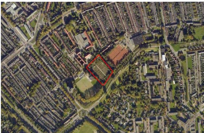
Schooltuinencomplex De Enk nabij 'Tuindorp Vreewijk'

De natuureducatieve tuin De Enk bestaat meer dan 50 jaar en ligt nabij een beschermde tuinwijk ('tuindorp' Vreewijk). Het schooltuinencomplex was van bij het begin gericht op de arbeiderswijk en is vanuit de verschillende buurten goed bereikbaar.