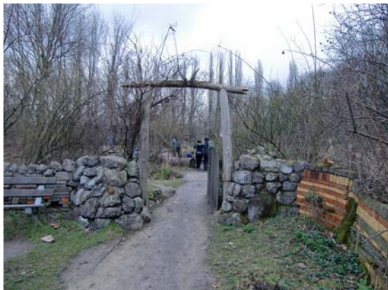
Speeldernis: Meerdere 'landscapskamers'.