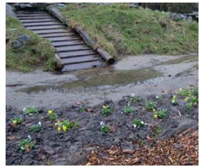
Woeste Weiden: buurtbewoners zorgen voor beplanting