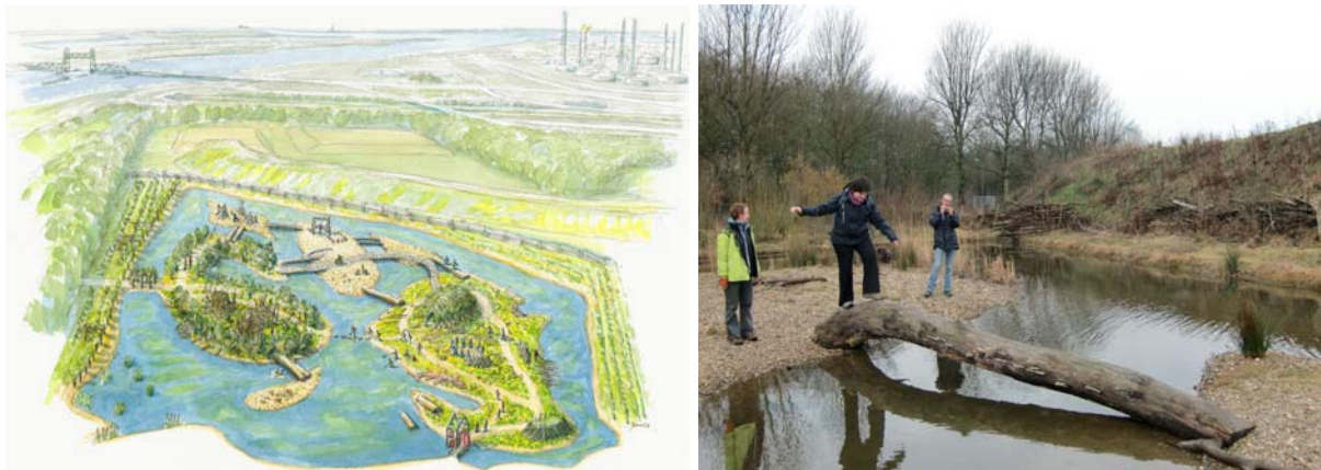
Ruige Plaat aan de Maasboorden: meerdere eilandjes met elk een eigen identiteit

De sterkste ontwerpen leggen ook de link met het landschap . Zo omvat de Speeldernis, gebouwd op een kleirijke bodem een weelderige vegetatie. In de Ruige Plaat (eveneens een ontwerp van Sigrun Lobst) wordt het oeverlandschap van de Maas geëvoceerd. De schrale kiezelbodem geeft een totaal ander landschapsbeeld. Elk eilandje krijgt eigen accenten en andere uitdagingen.