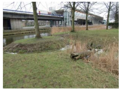
In het speel terrein wordt de relatie met water gelegd.

Bij de meer geïsoleerd gelegen terreinen blijkt permanente toegankelijkheid moeilijker te liggen.