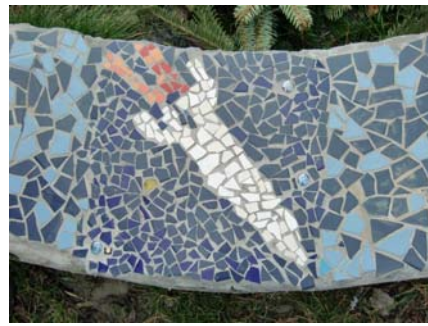
Wijkspiegelruimte Stellenbos: mozaïekproject'