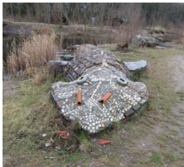
Ruige Plaat: collectief kunstwerk 'de steur'

Veel ontwerpers bouwen ook samen met bewoners : van zitbanken tot mozaïekmuren en beplanting. Daarbij moeten ontwerpers soms ook toegevingen doen (bijv. keuze voor exotische plantensoorten in de Woeste Weiden).