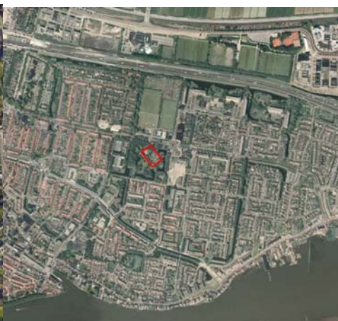
De Woeste Weiden in het centraal gelegen park