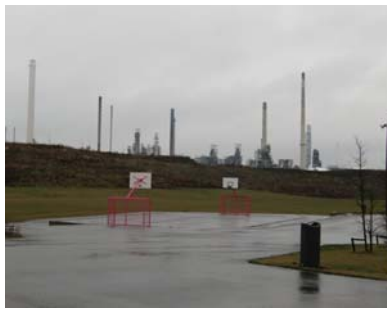
Omheinde recreatie- en evenementsite met zicht op de industrie